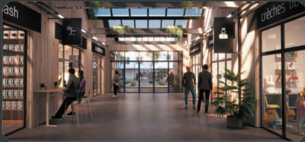
Conciergerie, crèche, brasserie, boulangerie, opticien, assurance...