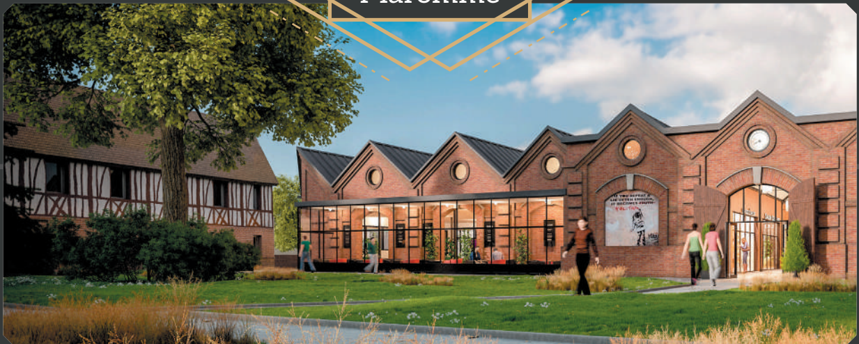
La Maison Pélissier et son parc, Le SHED: centre d'art contemporain de Normandie.