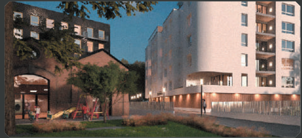
Jardin d'enfant, médiathèque et bibliothèque, espace culturel Beaumarchais...